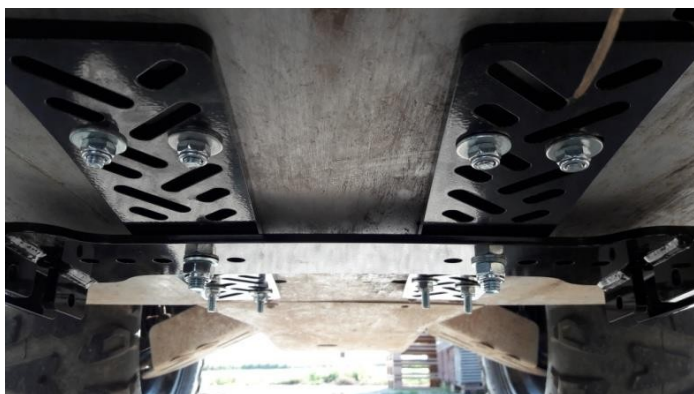
Obrázek č. 4: Poloha spojovací desky

Připojte spojovací desku k hlavním deskám sady. Nyní dobře utáhněte všechny matice.