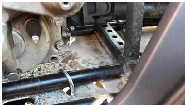
Obrázek č. 1: Pohled shora na zadní svorky

Umístěte šrouby M12x35 do obdélníkových otvorů hlavních desek a připevněte desky pomocí svorek k trubkám valivého podvozku. Matice nechte volné.