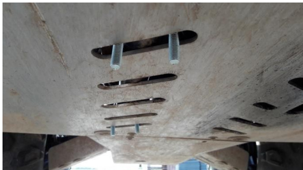
Obrázek č. 1: Poloha 1. páru svorek 2. Montáž hlavních desek

Nastavte upevňovací svorky na hlavní trubky valivého podvozku. Po sestavení smykových desek najděte otvory podle obrázku. # č. 1 a v případě potřeby upravte smykové desky s otvory pro upevňovací svorky nebo smykovou desku demontujte.