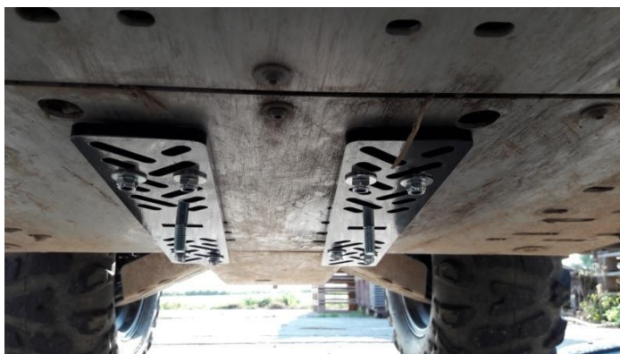
Obrázek č. 3: Hlavní desky montážní sady

Umístěte šrouby M12x35 do obdélníkových otvorů hlavních desek a připevněte desky pomocí svorek k trubkám valivého podvozku. Matice nechte volné.