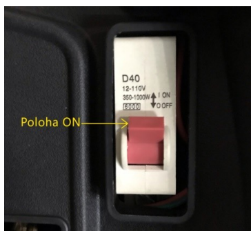
Hlavní elektrický vypínač (pod sedadlem)